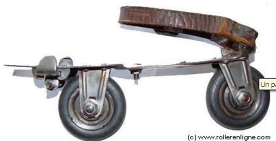
Patin de 1898