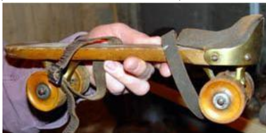
1863 : les rocking skate